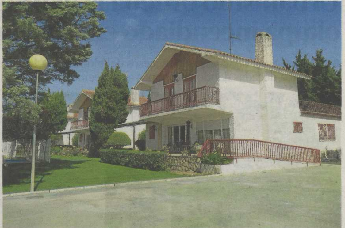
'Las Casitas', un espacio óptimo y cercano para la convalecencia y recuperación de las personas acompañadas.

Tras la experiencia tan positiva que ha supuesto, las Hijas de la