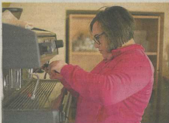
Una camarera con discapacidad intelectual.

Esta formación se dirige a profesionales de empresas y de