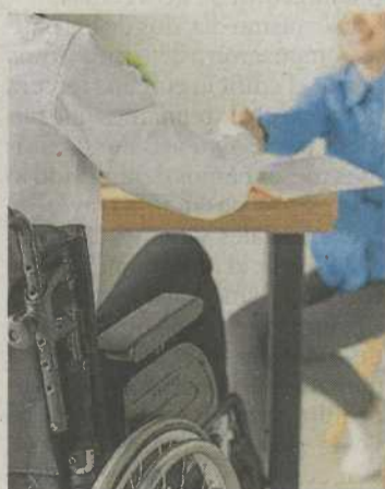
Consulta en asesoría fiscal.

una deducción de hasta 1.200 euros por un cónyuge que no esté legalmente separado y tenga discapacidad, siempre que no tenga rentas anuales superiores a 8.000 euros, excluyendo las exentas, y que no cumpla con los requisitos para las deducciones mencionadas anteriormente por descendientes o ascendientes con discapacidad.